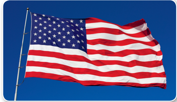
De nationale vlag van de VS wordt vaak de 'Stars and Stripes' genoemd.

Amerikanen gaan graag uit eten. Veel mensen die naar de VS reizen, zijn verbaasd over de enorme porties die in sommige Amerikaanse restaurants worden gegeven. Maar als je je eten in een restaurant niet op krijgt, kun je vragen of je het restje in een bakje mag doen om mee naar huis te nemen.